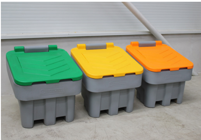
ARROW 400 různé farby veka