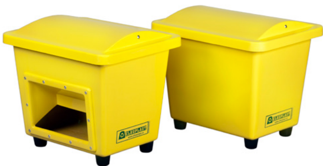
SBA 110 s/bez výsypného otvoru

Nádoby sú vyrobené zo sklolaminátu, vysoko odolného voči mechanickým, poveternostným a chemickým vplyvom (ľahké čistenie sprejových nástrekov). Na prianie zákazníka laminujeme logá, nápisy, čísla a pod. vo farebnom prevedení priamo na nádoby. Záručná doba 5 rokov.