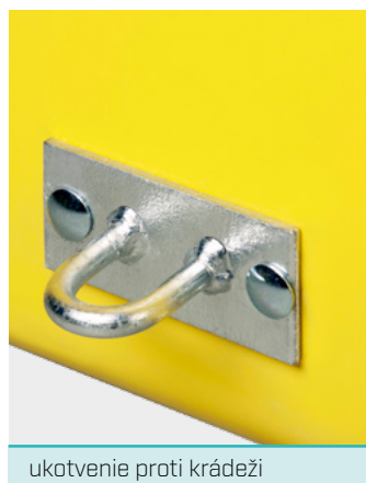
ukotvenie proti krádeži